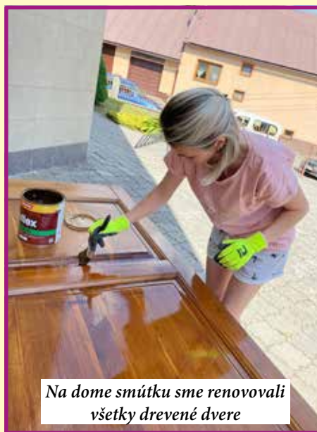
Na dome smútku sme renovovali všetky drevené dvere