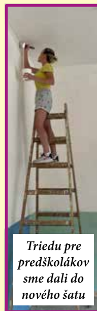
Triedu pre predškolákov sme dali do nového šatu