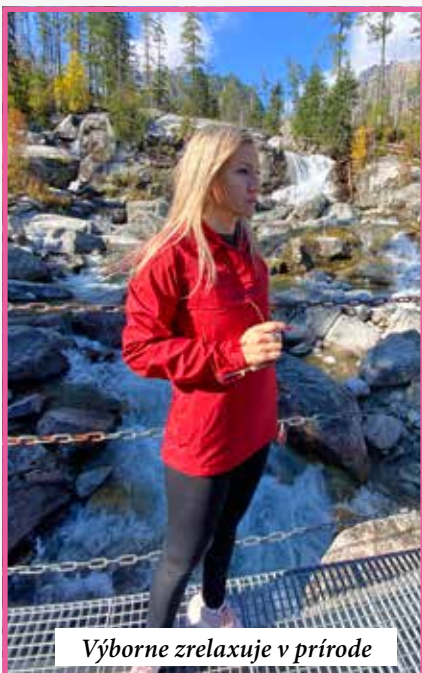
Výborne zrelaxuje v prírode

- Áno, ochrana životného prostredia je moja srdcovka. Už ako 10-ročná som sa vybrala na miestny úrad MNV a žiadala pridelenie klubovne. Moja zosnulá mama takmer dostala infarkt, keď jej volali z úradu, nech si príde k predsedovi pre dcéru :) . Moja ústna žiadosť bola vybavená kladne, prideliť ma na starosť príslušníkovi PZ a mesto mi darovalo kroniku, kde som začala písať príbeh tzv. klubovne Smerfov (postavičiek z populárnej kreslenej rozprávky). V klubovni sme sa stretávali deti z celej ulice, čistili sme spolu s pánom