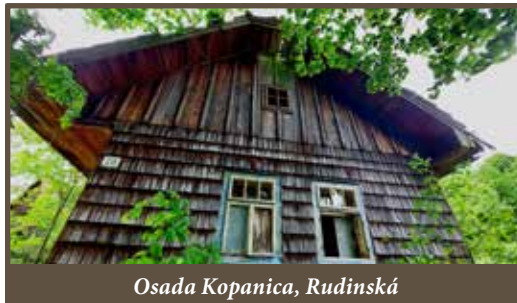
Osada Kopanica, Rudinská