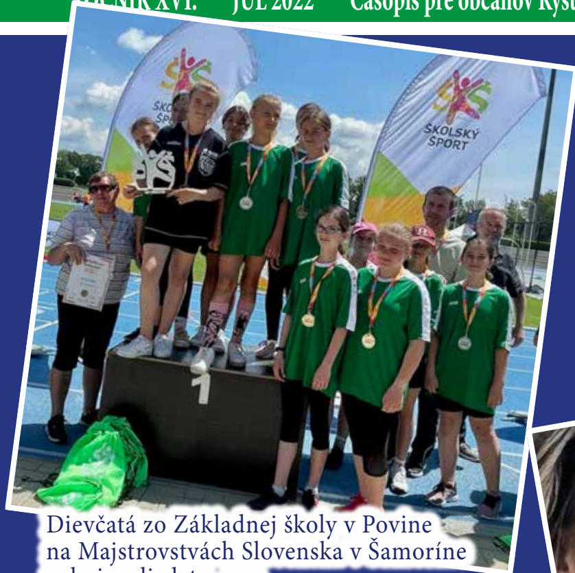
Dievčatá zo Základnej školy v Povine na Majstrovstvách Slovenska v Šamoríne vybojovali zlato /str.22

ROČNÍK XVI. * JÚL 2022 * Časopis pre občanov Kysuckého Nového Mesta a Dolných Kysúc