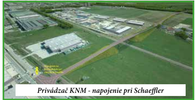
Privádzач KNM - napojenie pri Schaeffler