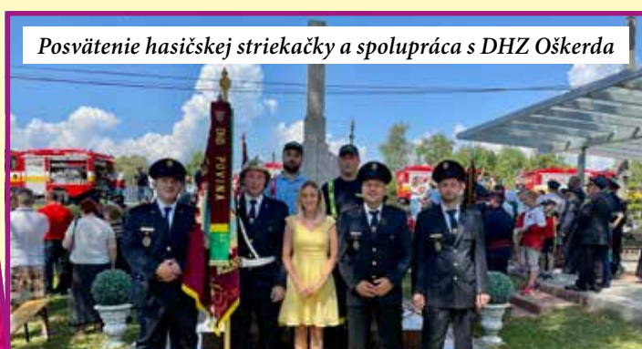
Posvätenie hasičskej striekačky a spolupráca s DHZ Oškerda