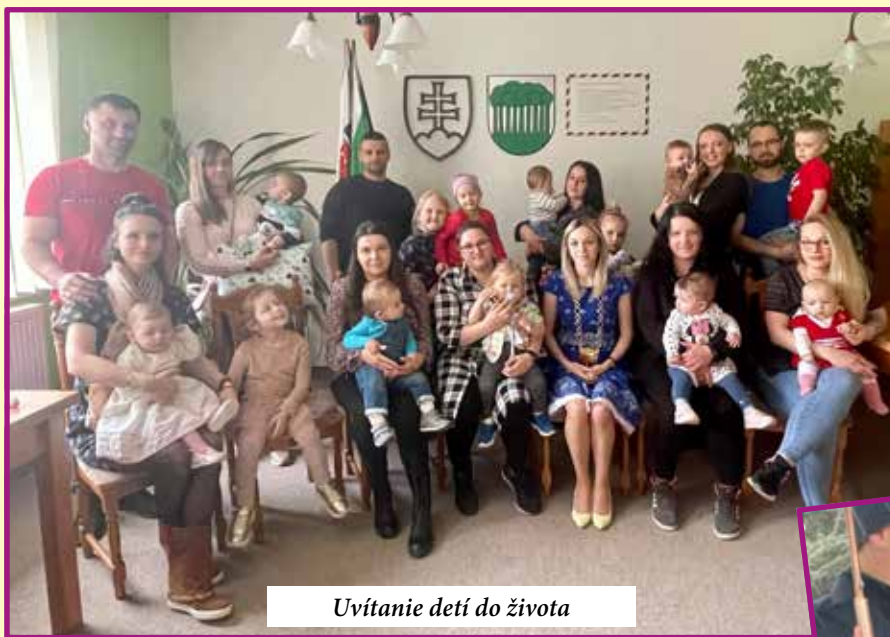
Uvítanie detí do života