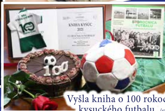
Vyšla kniha o 100 rokoch kysuckého futbalu /str.6