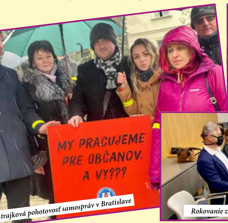
trajková pohotovosť samospráv v Bratislave