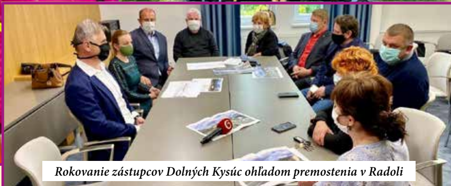
Rokovanie zástupcov Dolných Kysúc ohľadom premostenia v Radoli