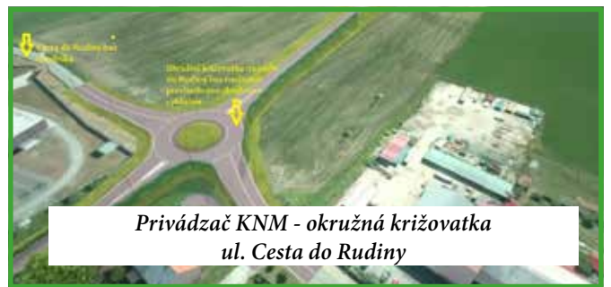
Privádzач KNM - okružná križovatka ul. Cesta do Rudiny