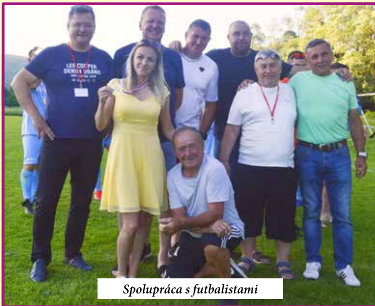
Spolupráca s futbalistami