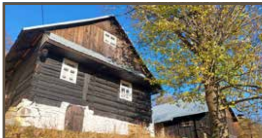
Drevenica z 19. storočia v osade Harvanovci, obec Zákopčie, národná kultúrna pamiatka