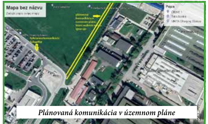
Plánovaná komunikácia v územnom pláne